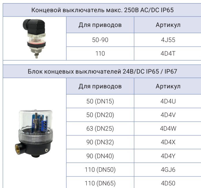
Таблица для заказа аксессуаров